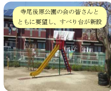
寺尾後原公園の会の皆さんとともに要望し、すべり台が新設

内で一番少なくなっています。寺尾地域の方から、次々と住宅が増え緑地が減っている。公園が欲しいとの声も寄せられています。緑地の保全や公園などについても用地取得を計画的に取り入れていくべきだと指摘し、生産緑地地区を将来、公共施設や公園などに活用するのかが質しました。同部長は、法では自治体の責務として、公園、緑地その他の公共空地の整備の状況と将来の見通しを勘案するとされている。緑のオープンスペースの確保や合理的な土地利用転用などは課題。国でも直轄調査を実施しているその結果を注視していくと答えました。