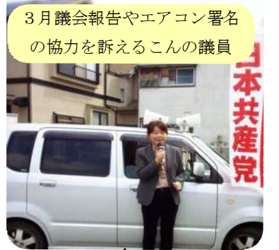
3月議会報告やエアコン署名の協力を訴えるこの議員

内で一番少なくなっています。寺尾地域の方から、次々と住宅が増え緑地が減っている。公園が欲しいとの声も寄せられています。緑地の保全や公園などについても用地取得を計画的に取り入れていくべきだと指摘し、生産緑地地区を将来、公共施設や公園などに活用するのかが質しました。同部長は、法では自治体の責務として、公園、緑地その他の公共空地の整備の状況と将来の見通しを勘案するとされている。緑のオープンスペースの確保や合理的な土地利用転用などは課題。国でも直轄調査を実施しているその結果を注視していくと答えました。