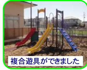
複合遊具ができました