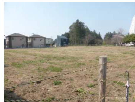
市が先行取得した霞ヶ関西公民館用地(右奥が川越西高校)

公民館未整備地区となっている霞ヶ関西地域では地域の懇話会から、平成20年に建設候補地、本年1月には導入機能につい