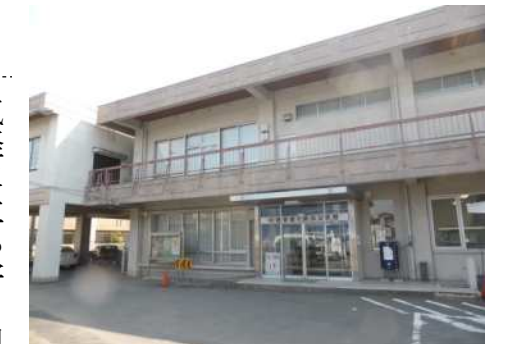
霞ヶ関北公民館は昭和49年に建設され、築後40年近く経過する

霞ヶ関北公民館は、市内で最も高齢化が進んでいる地域にあり、老朽化とともにバリアフリーでなく高齢者なども利用し難い現状です。また、地域では誰もが