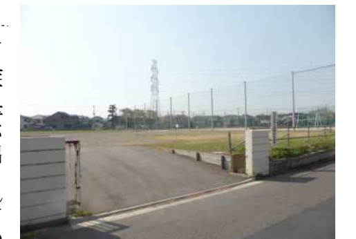
旧霞ヶ関北小跡地。西側(右奥)は公園として利用されている